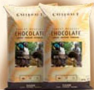
Fairtrade gecertificeerde donkere chocolade

dezelfde smaak, verwerkbaarheid, viscositeit en constante kwaliteit als de klassieke chocolades!