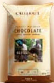
Fairtrade gecertificeerde melkchocolade