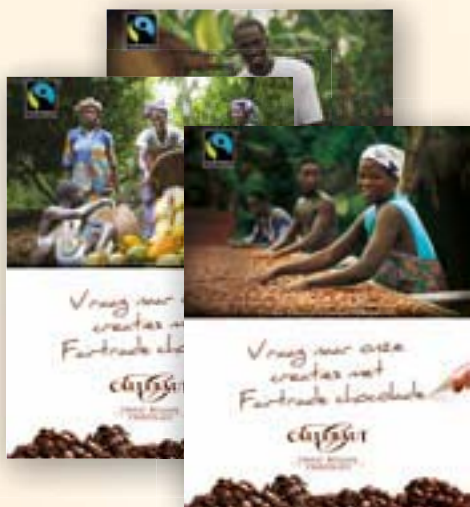
Posters 60 x 80 cm