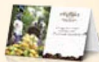
Tentdisplay 5 x 8 cm