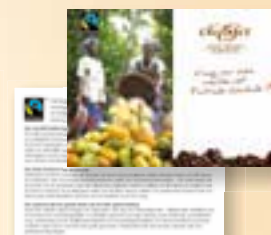
Informatiekaart 7,5 x 10 cm