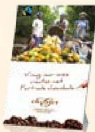
Display 14,5 x 21 cm