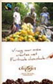
Deurstickers 12,5 x 20 cm