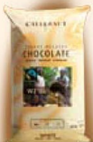
Fairtrade gecertificeerde witte chocolade